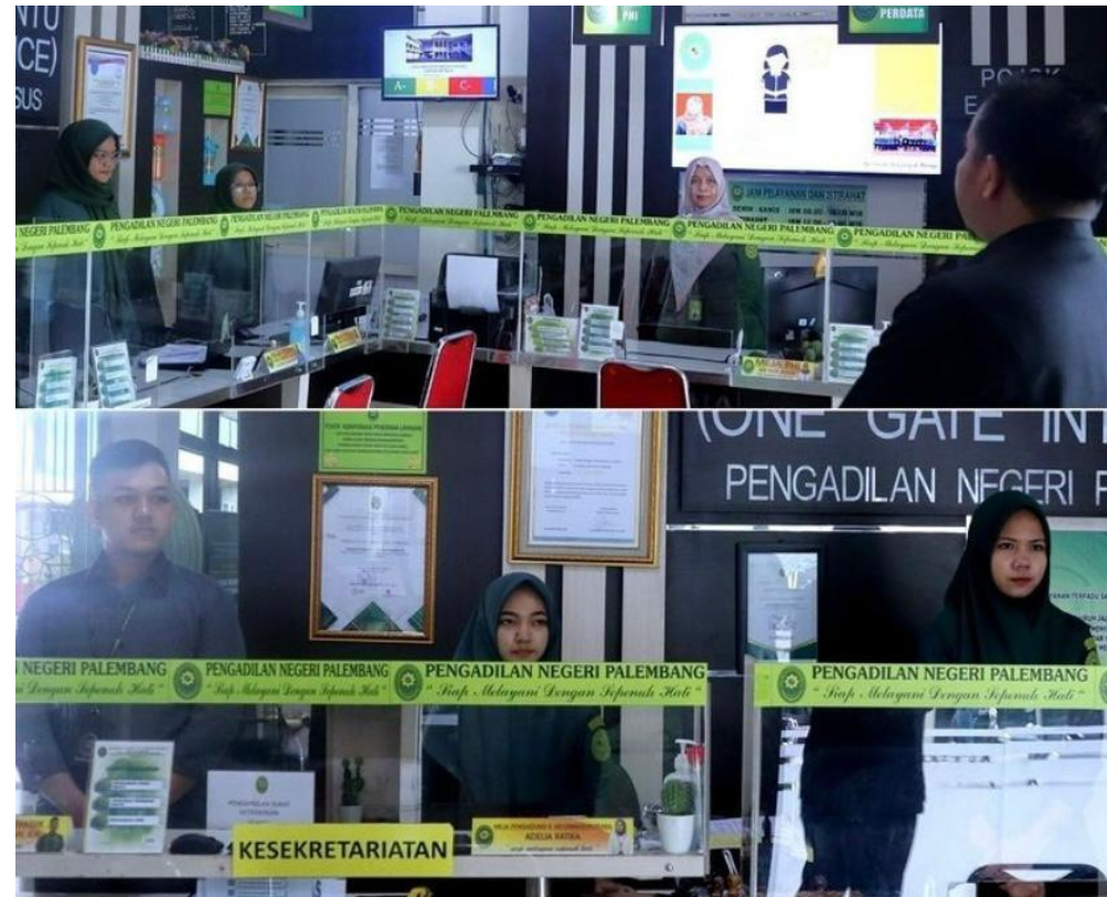
BRIEFING PETUGAS PTSP