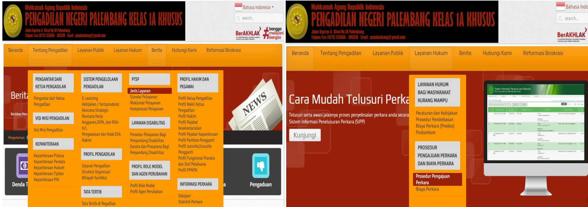
INFORMASI LAYANAN PADA WEBSITE