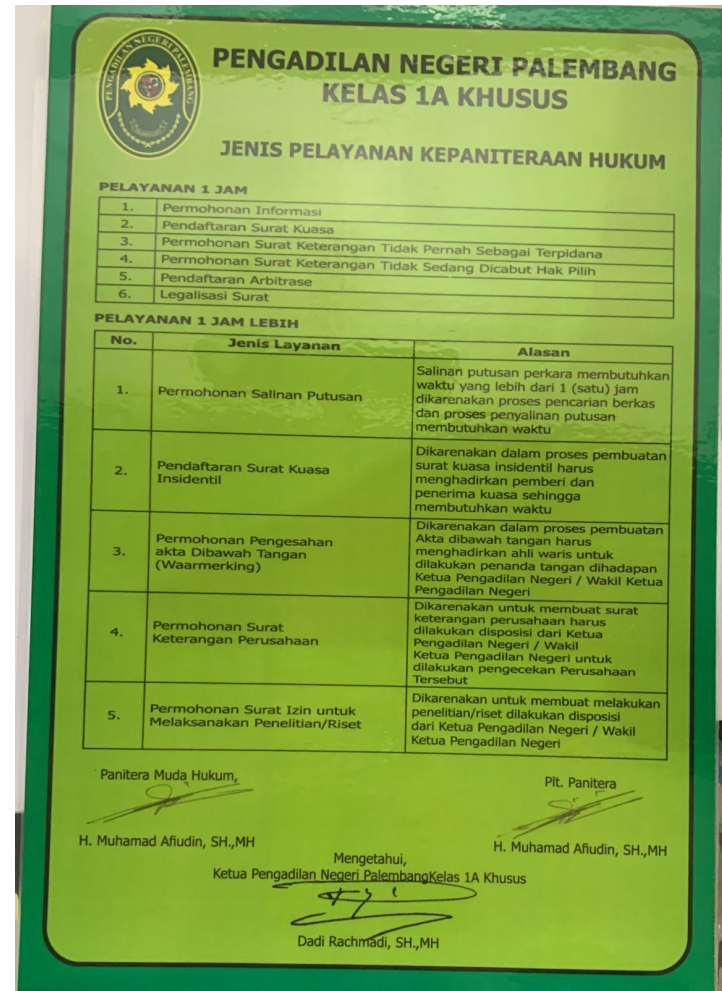
JENIS LAYANAN PADA RUANG PTSP